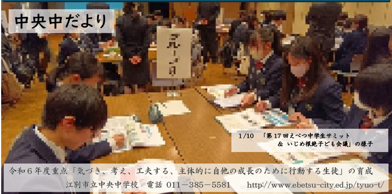
1/10 「第17回えべつ中学生サミット & いじめ根絶子ども会議」の様子

令和6年度重点「気づき、考え、工夫する、主体的に自他の成長のために行動する生徒」の育成